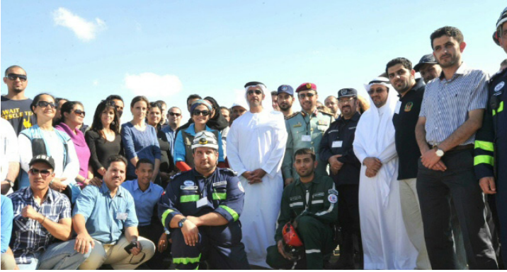
سمو الشيخ سيف يحضر تدريب فريق الأمم المتحدة لتقييم الكوارث والتنسيق للمتحدثين باللغة العربية، في أبوظبي.

وقد حضر الفريق سمو الشيخ سيف بن زايد آل نهيان، نائب رئيس مجلس الوزراء وزير الداخلية، تمرين المحاكاة المكثف الذي استمر لمدة 36 ساعة والذي يعد جزءاً أساسياً من التدريب في منطقة الشليله بأبوظبي. وفي سياق حديثه أثناء الحدث، قال سموه: "إن تنسيق جهود فرق البحث والإنقاذ يعتبر أهم عوامل نجاح محاولات إنقاذ الأرواح ويوفر أفضل مساعدة إنسانية وإغاثة في أوقات الأزمات."