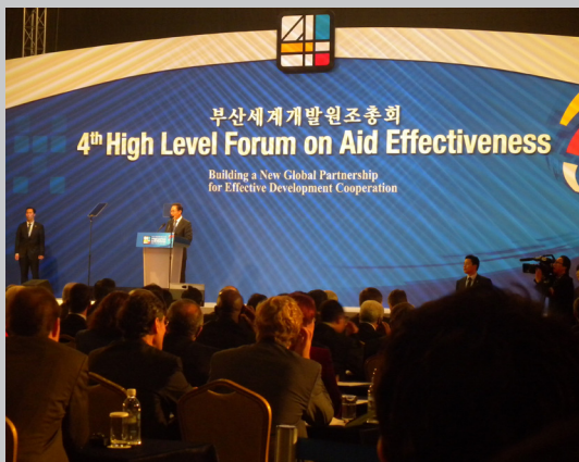
UAE delegates attended the 4th High-level Forum on Aid Effectiveness in Busan, Korea.

Over 3,500 delegates took part in this final international meeting on the topic of "Aid Effectiveness". The Busan Outcome Document, endorsed at the last session, requests UNDP and OECD to work together with governments to establish the architecture for a new Global Partnership for Effective Development Cooperation, with the focus on the effectiveness of sustainable development in each recipient country, and on monitoring the ways in which aid contributes to strengthening each country's own systems.