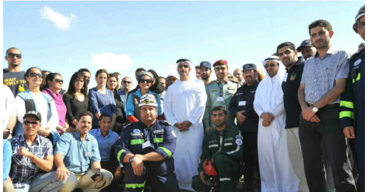
HH SHEikh Saif attends the UNDAC training for Arabic speakers, in Abu Dhabi.

HH Lt. General Sheikh Saif bin Zayed Al Nahyan, Deputy Prime Minister and Minister of Interior, attended the intensive 36-hour simulation exercise, a core part of the induction training, in the Shaleila area in Abu Dhabi. Speaking at the event, HH Sheikh Saif said that the coordination of efforts by search and rescue teams is of utmost importance in order to save lives and provide the best possible humanitarian assistance at times of disasters.